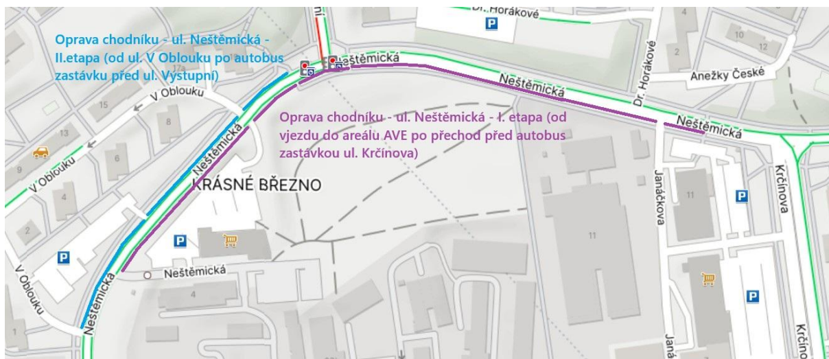
Schéma – lokalizace míst opravy – Neštěmická – II. etapa (od ul. V Oblouku po autobus zastávku před ul. Výstupní) (ozn. modré zvýraznění)

Začátek II. etapy – napojení na komunikaci pro pěší, přeložení poškozené stávající zámkové dlažby (při bourání), snížený silniční obrubník, varovný pás pro nevidomé